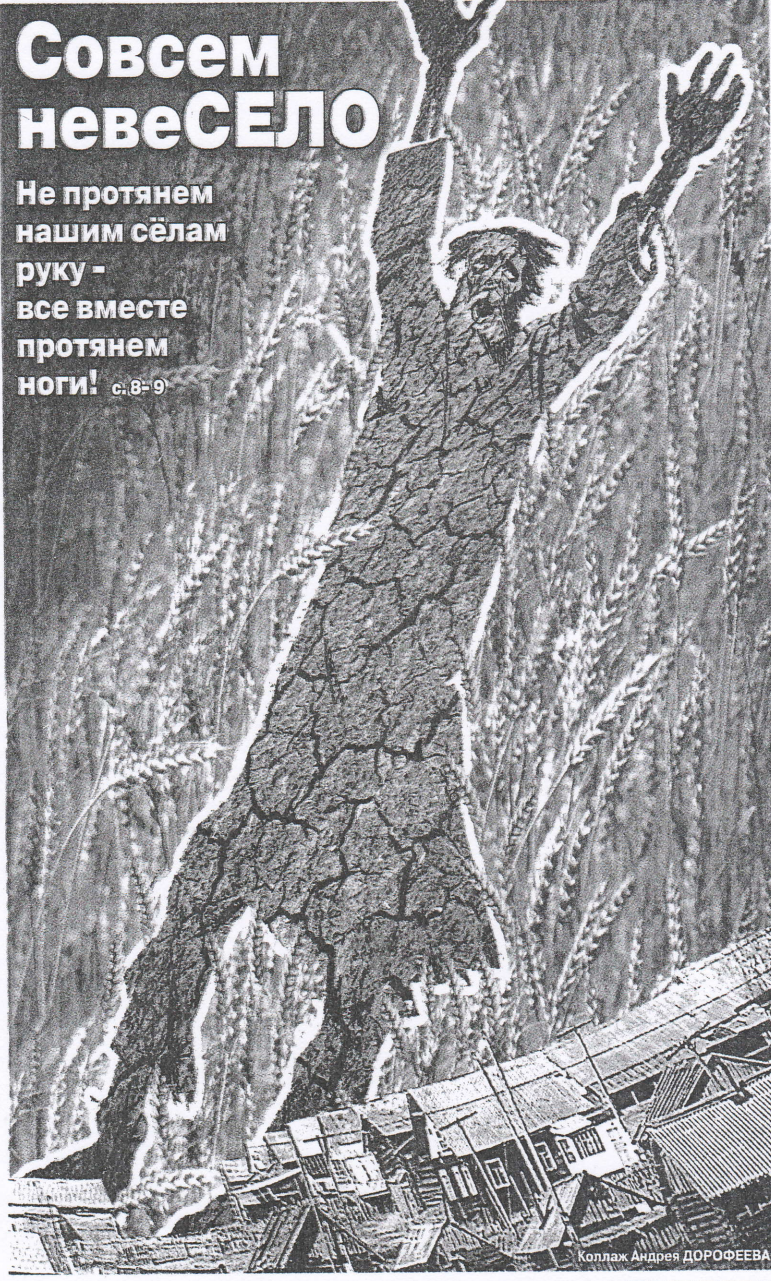
Коллаж Андрея ДОРОФЕЕВА

Не протянем нашим сёлам руку - все вместе протянем ноги! с.8-9